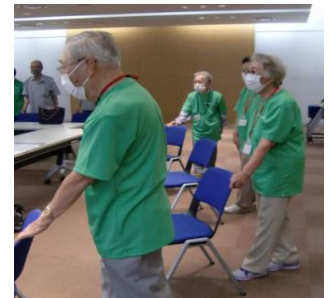
バランス運動など

体力や気力が落ちてきた「フレイル状態」にある方に対して、ケアマネジャーが担当し、元気を取り戻すお手伝いをします。 週2回、約3か月間の通所プログラムでフレイルを学び運動を行いながら、理学療法士による訪問でセルフケアを提案します。 事業が終了しても、ご自身で健康習慣を継続できるように支援するプログラムです。