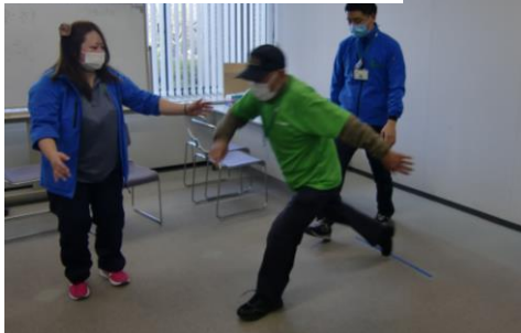
毎月体力測定実施