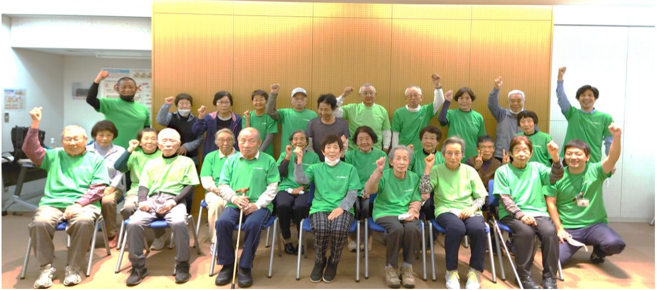
毎月体力測定実施