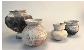
東海（左2点）、北陸地方から 纏向遺跡に運ばれた土器