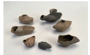
鳥形の土製品 （唐古・鍵、纏向遺跡）

奈良盆地東南部はヤマト王権誕生の地です。中でも、唐古・鍵遺跡と纏向遺跡（桜井市）は、弥生時代から古墳時代にかけての大集落であり、ヤマト王権誕生に大きな役割を担った遺跡です。