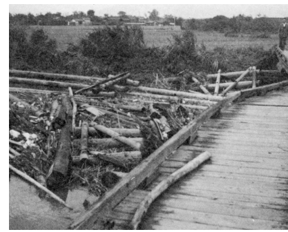
昭和34年 伊勢湾台風襲来