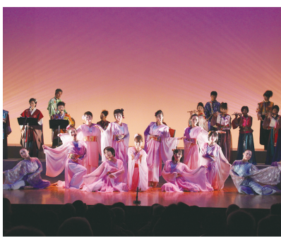
平成24年 古事記1300年記念フォーラム