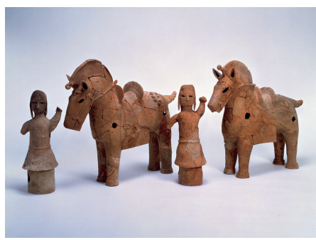
平成28年 笹鉾山2号墳出土品が県有形文化財に指定