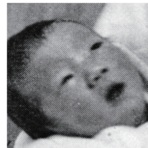
昭和58年 町の人口3万人を突破