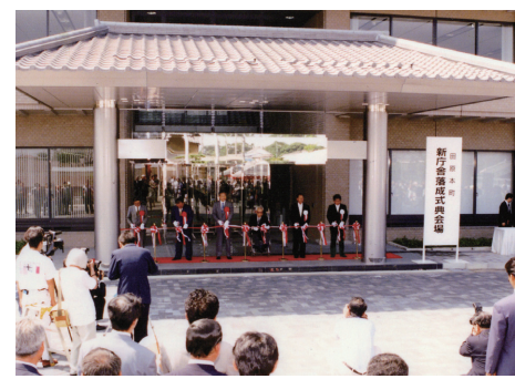
平成6年 町役場新庁舎落成