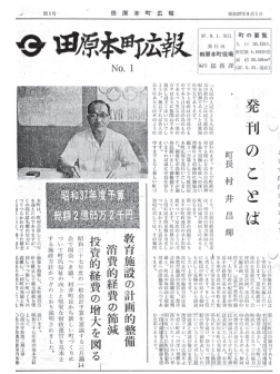
昭和37年 広報紙第1号を発刊