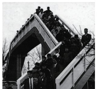
昭和42年 鍵に歩道橋完成