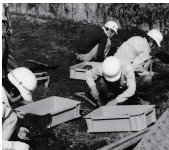
昭和52年 唐古遺跡第3次発掘調査開始。遺跡の名称が唐古・鍵遺跡に改名