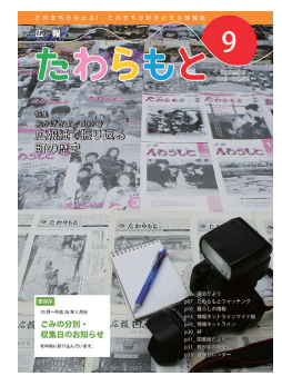
平成25年 広報たわらもと500号発行