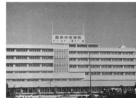
平成5年 国保中央病院診察開始