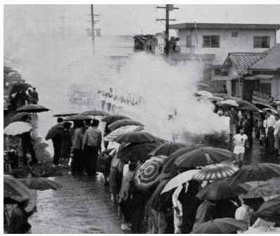
昭和39年 東京オリンピック聖火リレー通過