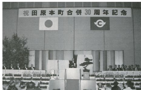
昭和61年 田原本町合併30周年記念祝賀式典開催