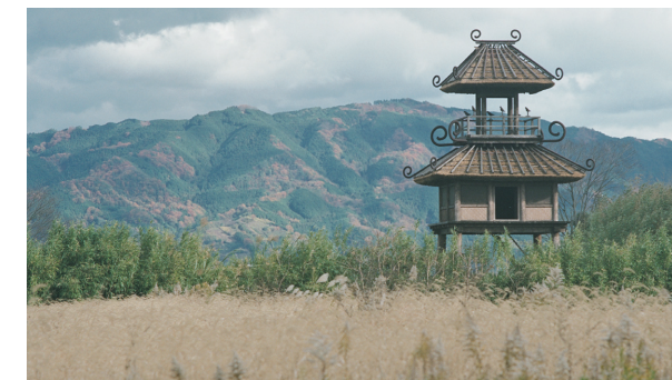
平成6年 唐古池に復元楼閣が落成