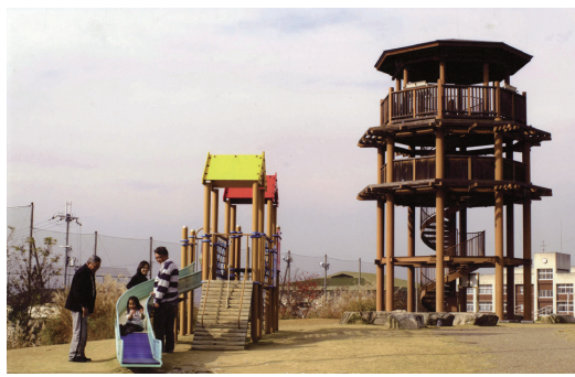
平成12年 しきのみちはせがわ展望公園「えのき広場」「ながめの丘」完成