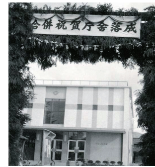
昭和33年 町役場庁舎落成