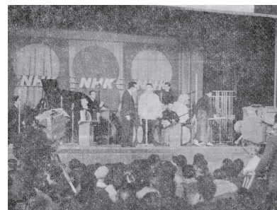
昭和44年 NHKのど自慢素人演芸会開催