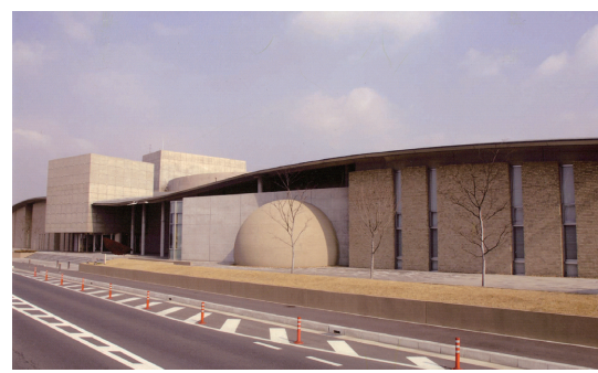
平成16年 田原本青垣生涯学習センター完成