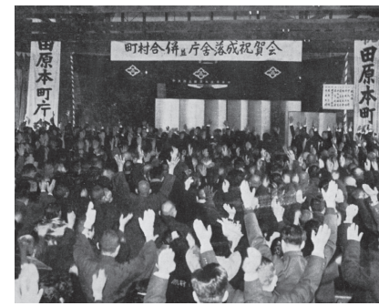
昭和34年 田原本町合併記念祝賀会開催