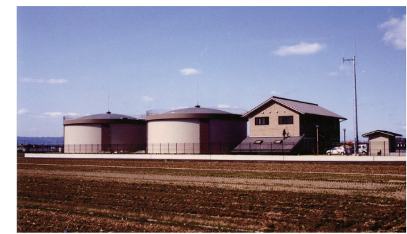
平成15年 田原本町配水場完成