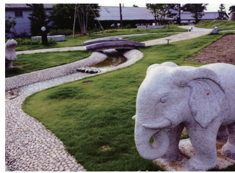
平成11年 しきのみちはせがわ展望公園「すいせんの丘」完成