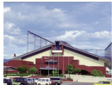
昭和57年 中央体育館落成