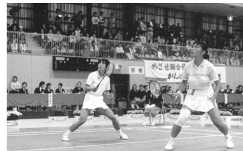
昭和59年 第39回国民体育大会「わかさ国体」開催。本町ではバドミントン競技開催