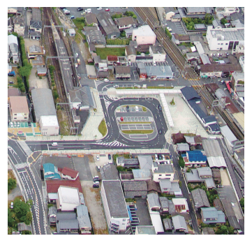
平成22年 田原本駅前広場完成