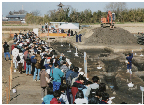
平成11年 唐古・鍵遺跡が国の史跡に指定