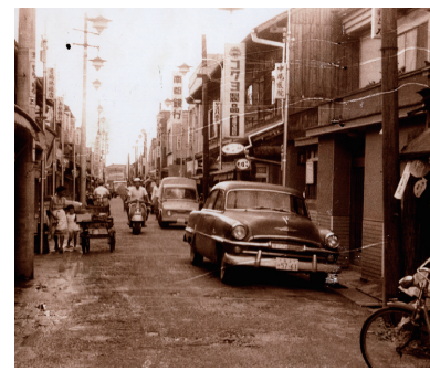
昭和30年頃 田原本駅前通り