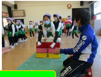
『げんきっこ教室（体育指導）』