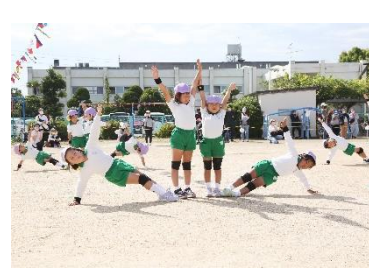
がんばった運動会