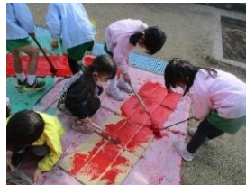
『絵画・制作』 クレパス、絵の具、スタンプ遊び、いろいろな技法を経験。 ハサミや糊も使って、工夫しながら作ったよ。