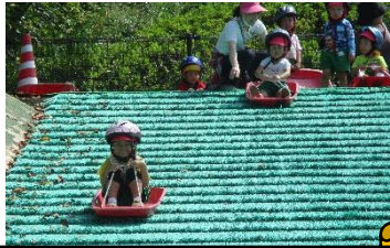
楽しかった秋の遠足