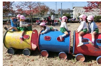
西竹田の公園で遊んだよ。どんぐりも見つけたよ。