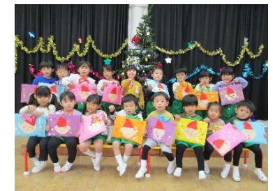
モミの木飾って、メリークリスマス！