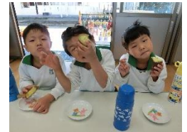
「おいも、おいしかったよ。」