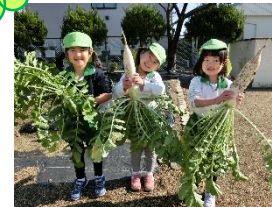
お米作りに大根やさつまいもの収穫体験。収穫の喜びを感じた子どもたちでした。