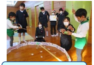
平野小学校との交流