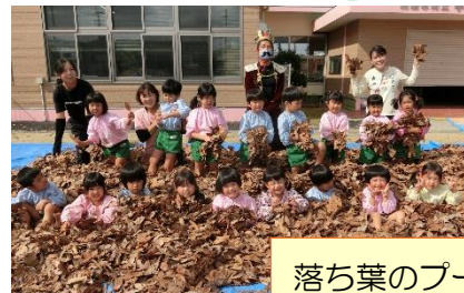
落ち葉のプールで遊んだよ。