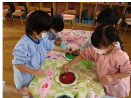
「スタンプペタペタ、楽しいね。」