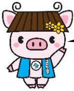
田原本町公式キャラクター『タワラモン』