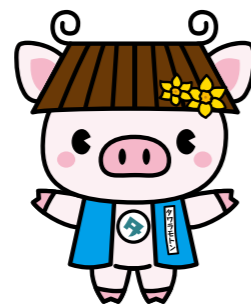
田原本町公式キャラクター 「タワラモン」