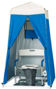
マンホールトイレ