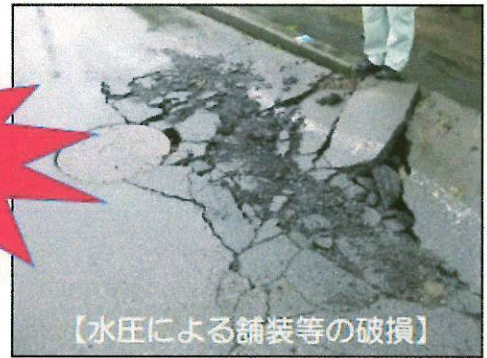
【水圧による舗装等の破損】

【被害発生】 平成26年8月台風11号の時に、雨水が下水管へ流れ込み、マンホールから下水が溢れ出たり、水圧により舗装等が破損する事故がありました。