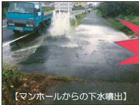
【マンホールからの下水噴出】

【原因】 雨水を流す雨樋などの排水が、「污水管」につながれていることや雨天時に汚水ますの蓋を開けて宅内の雨水を排水していること等が原因です。