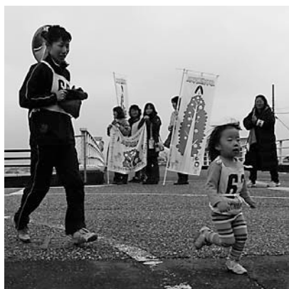
ゴールまであと少し。(昨年の大会)