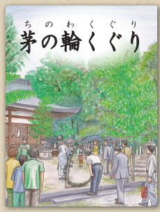
ちのわくぐり 茅の輪くぐり

田原本ふるさとかるたは、町にある有名な遺跡や伝統ある神社、寺などの名所、さらに伝統行事などを題材に作られています。かるたで、郷土を学びましょう。