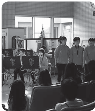
▲会場を盛り上げた田原本中学校吹奏楽部のコンサート

▼1次試験 2月4日(土)：筆記試験 ▼2次試験 2月18日(土)：面接(1次試験合格者のみ) 申込書配布期間・受付期間 1月4日(水)～18日(水)午前9時～午後5時(土・日曜日、祝日を除く) 受付場所・持参書類 国保中央病院2階事務部企画総務課まで受験申込書、履歴書(写真付)、技師(士)・看護師免許の写しを持参してください。(代理人可、郵送不可) 10月29日に、健康フェスティバルを開催しました 日差しも暖かくよく晴れ上がった秋の日、地域医療の充実と向上に向けて健康フェスティバルを開催しました。 健康相談・測定コーナー・メタボ体操・フードコーナーなどを実施し、特にフードコーナーのぜんざいは皆さんに喜んでいただき大好評でした。また、田原本中学校吹奏楽部の若さあふれる華やかなコンサートも行われました。