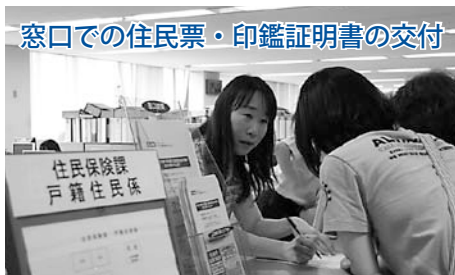
窓口での住民票・印鑑証明書の交付