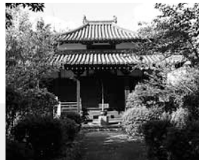
▲法楽寺 ◀宮古薬師堂 「薬師如来坐像」