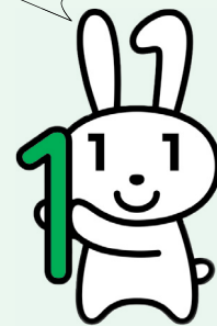
マイナンバーキャラクター「マイナちゃん」

以上になった場合でも、ホッチキス留めはされません。2枚目以降の取り忘れにご注意ください。 ●誤って発行した証明書の返金や交換はできません。また、条例で手数料が免除となる人でもコンビニ交付の場合は手数料がかかります。 免除を希望される場合は住民保険課の窓口で取得してください。