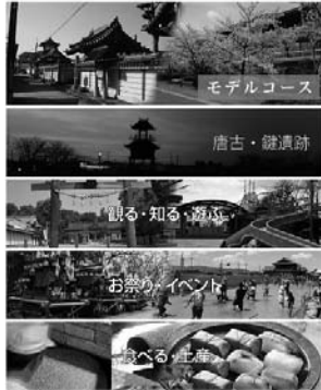
▲アプリトップページ

「ココシルたわらもと」に掲載を希望される飲食店や土産物店を募集します。登録要件など詳細は観光・まちづくり推進課へお問い合わせください。