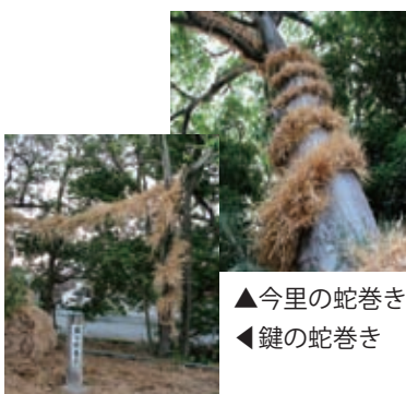
▲今里の蛇巻き ▼鍵の蛇巻き

石見駅→おうてくれ地蔵→今里の浜→今里杵築神社（蛇巻き）→唐古・鍵遺跡（田中の庄）→製菓工場→スイカ・メロン種苗会社→鍵の蛇巻き→田原本町役場（陣屋跡）→田原本駅