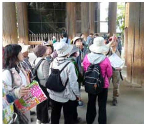
▲ボランティアガイドの説明を聞く

町では、省エネの一層の推進を通じて、地球温暖化防止を図るため、また、夏季の節電対策の一環として、積極的に町施設における「適正冷房（28℃）」とそれにふさわしい職員の「軽装」（「ノー上着、ノーネクタイ」）を推進しています。 皆様のご理解とご協力をお願いします。