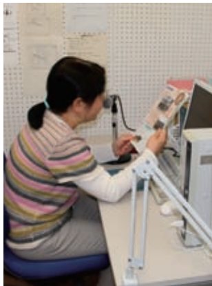
▲パソコンに録音する

また、音訳ボランティアも随時募集 しています。興味のある人はお問い合わせ ください。