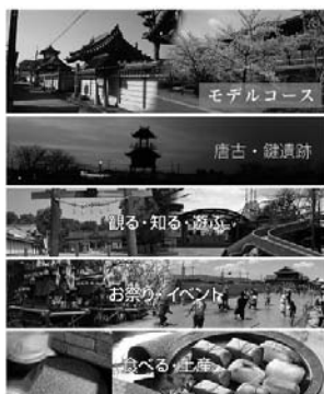
▲アプリトップページ

「ココシルたわらもと」に掲載を希望される飲食店や土産物店を募集します。登録要件など詳細は観光・まちづくり推進課へお問い合わせください。