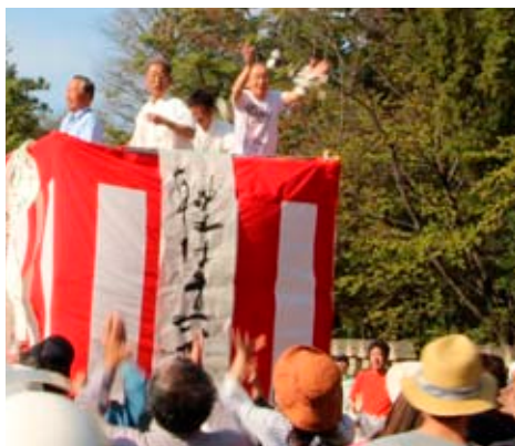
▲もちまきが行われる

4月23日、田原本駅周辺で、町地域公共交通活性化協議会主催の「やどかり市」が開催されました。 駅周辺が歩行者天国となり、既存店舗による一店逸品や50以上のテナトブースの出店などの楽しい企画により、大勢の人で賑わい大盛況となりました。 今回、新企画となる県立御所実業高校の生徒が製作したミニ新幹線乗車体験や、天理警察署とJAFによる交通安全啓発ブースは、子どもたちにも大人気でした。