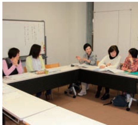
▲勉強会で意見を出し合う

声の広報紙「音訳広報たわらもと」を町 役場のホームページに掲載しています。 「最近、目が悪くなって字が読みにく くなった」という人だけではなく、「活字 を読むのが苦手」という人にもお勧めです。 目の不自由な人にはCDまたはカセットテ ープの音訳広報を無料で送付しています。 希望する人は、図書館までお問い合わせ ください。