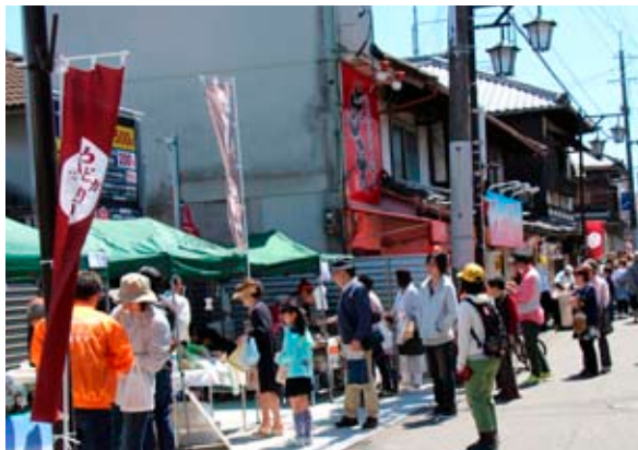
▲大勢の人で賑わう戒通り