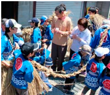
▲道中、人々を綱で巻いて祝う

5月5日、矢部で豊作を祈願する祭り「綱かけ」が行われ、一同が綱を持って伊勢音頭に合わせて村中を練り歩きました。道中、慶事のあった家、自治会役員宅、当屋宅などに綱を持ち込んで祝い、家の人を綱で巻いていきました。 村を周回すると、村の南端小字ツナカケにある木に綱が掛けられ、僧侶の読経とともに参加者たちは豊作と村の安全を祈願しました。