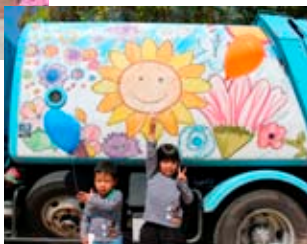
▶ラッピングされたパッカー車の前で

4月23日、田原本駅周辺で、町地域公共交通活性化協議会主催の「やどかり市」が開催されました。 駅周辺が歩行者天国となり、既存店舗による一店逸品や50以上のテナトブースの出店などの楽しい企画により、大勢の人で賑わい大盛況となりました。 今回、新企画となる県立御所実業高校の生徒が製作したミニ新幹線乗車体験や、天理警察署とJAFによる交通安全啓発ブースは、子どもたちにも大人気でした。