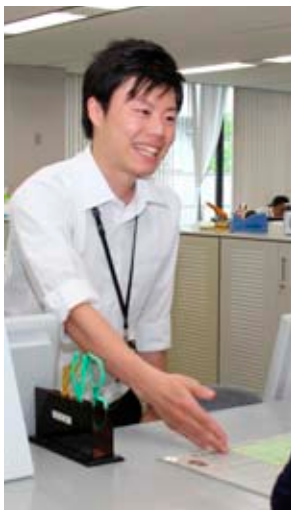
☎ 人事課人事係 ☎ 34-2056

町では、省エネの一層の推進を通じて、地球温暖化防止を図るため、また、夏季の節電対策の一環として、積極的に町施設における「適正冷房（28℃）」とそれにふさわしい職員の「軽装」（「ノー上着、ノーネクタイ」）を推進しています。 皆様のご理解とご協力をお願いします。