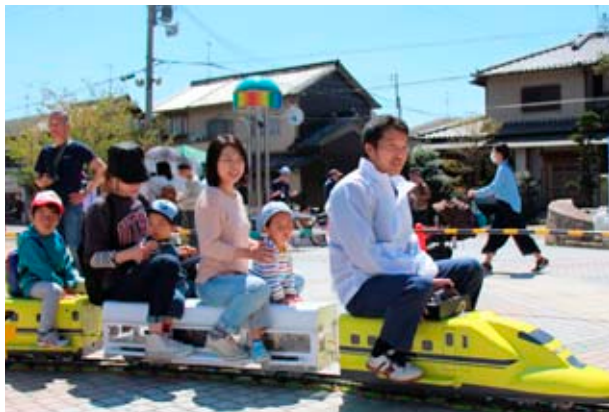
▲高校生手作りのミニ新幹線に乗車体験