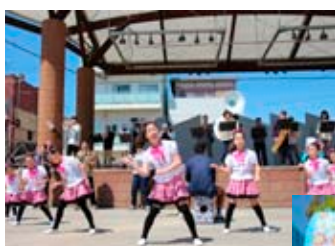
◀踊りと演奏で会場を盛り上げる