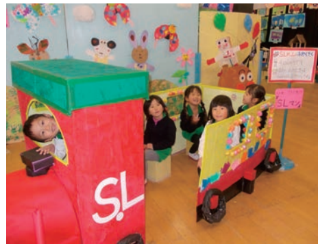
▲SLマンに乗って、アンパンマンの世界に 出発!