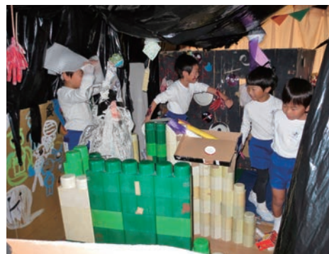
▲どうしたら皆がびっくりするか考えたよ。 怖いお化けに「へーんしん!!!」