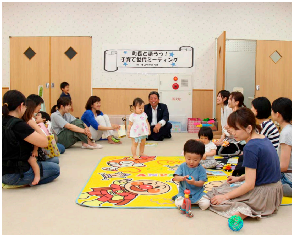
▲子どもたちを遊ばせながら、和気あいあいとした雰囲気で見聞交換