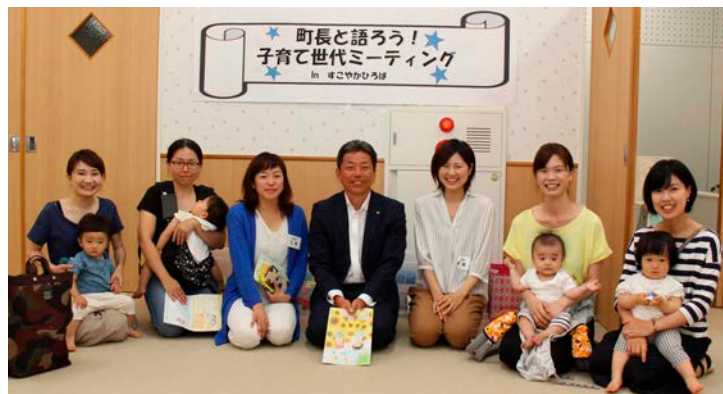
▲子育てママたちと町長

7月3日、保健センター3階すこやかひろばで、子育て意見交換会、町長と語ろう！子育て世代ミーティング in すこやかひろば」を開催しました。 これは、子育て世代の意見を直接把握する機会を設けることで、ニーズを把握し、今後の子育て施策に反映させることを目的に、今回初めて開催しました。 当日は、子育てママ10人が参加し、子育てに関する活発な意見交換がなされました。