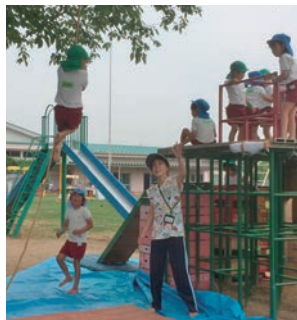
▲ロープをしっかりつかんで、 ジャングルジムから大きくジャンプ!