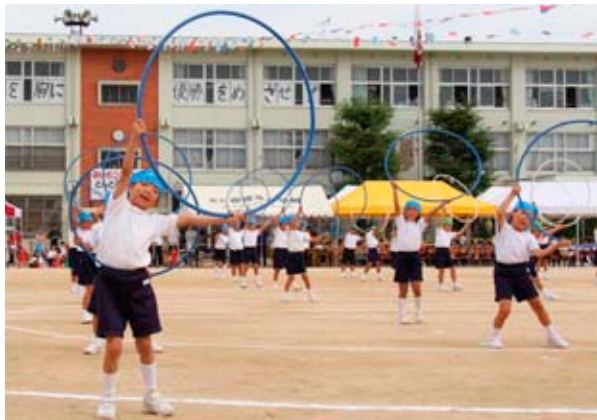
▲フープを使って元気に踊る