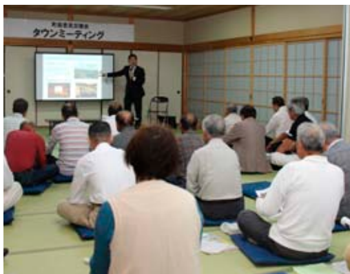
▲町長から説明が行われる

9月30日、八尾公民館で出前タウンミーティングが開催され、45人が参加されました。これは、町政についての理解を深めていただくとともに、町政に対するご意見などを承るために行うものです。 町長が「田原本町のまちづくり」について説明した後、参加者からさまざまなご意見やご提案が出されました。ご意見やご提案の内容については、町ホームページをご覧ください。