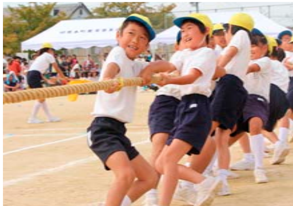
▲力を合わせて綱を引く