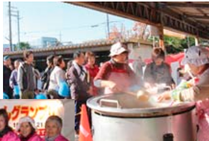
▲農業祭で「やよい汁」を振る舞う

また「あったかもんグランプリ」では味間いもを使ったメニューを出品し、平成27年2月には特別賞を受賞しました。味間いもを全国的にPRするために町とも連携しながら、今後も活動を進めていきます。女性部ではさまざまなことを体験