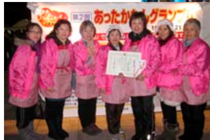
◀第2回「あったかもんグランプリ」で特別賞を受賞

し、勉強することで友達や知り合いをたくさん作って、お互いに学び、伝え、教え、よかったと言ってもらえるよう、若い女性の加入にも積極的に取り組み、幅広い年代と一緒に参加できる活動を今後も企画していきます。