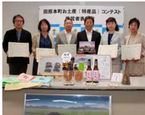
▲受賞作品を前に、表彰状を持つ受賞者ら

9月22日、町役場で「田原本町お土産(特産品)コンテスト受賞者表彰式」が開催されました。町内を心に応募があった53点の中から選ばれた、金・銀・銅賞の各受賞者が森町長から表彰状を受け取りました。 受賞者はお土産を作るきっかけや苦心したこと、お土産への思い入れなどを語り合っていました。 お土産は平成30年春オープン予定の道の駅「レスティ 唐古・鍵」で販売される予定です。