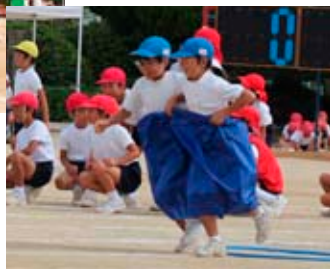
▶2人の心を一つにして走る