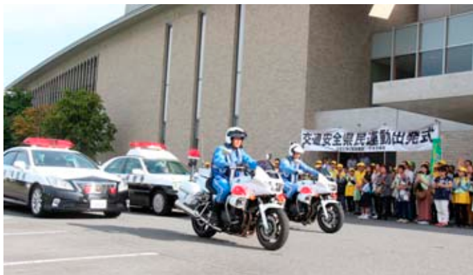
▲関係者に見守られパトロールに向かう

25日には磯城野高校生がドライバーに啓発物品を配布、26日にはティッシュを配り、交通安全と交通事故防止を呼びかけました。