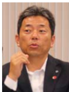
町長 章浩 森