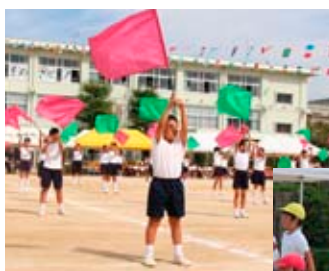
◀フラッグによる鮮やかな演技