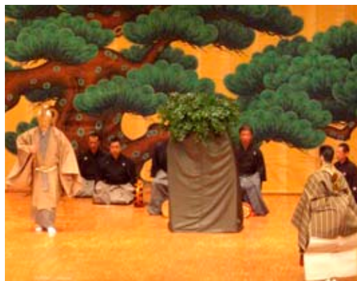
▲伝統芸能の能が演じられる

9月30日に行われた田原本小学校の運動会では「チームの絆を胸に優勝めざせ！」をスローガンに、4チームに分かれて点数を競いました。児童たちは、保護者や地域の人たちの応援を背に受け、綱引きやリレーなどで競い合いました。また、日々の練習の成果を発揮し、息を合わせたダンスや組み立て体操を披露しました。