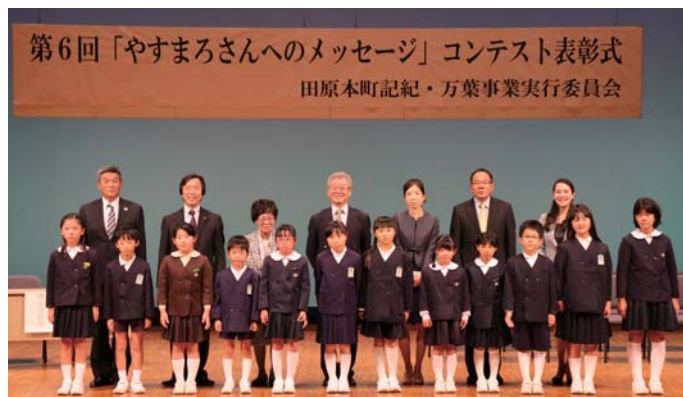
▲受賞者全員で記念撮影