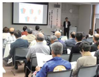
▲タウンミーティングの様子