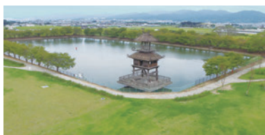
▲唐古・鍵遺跡史跡公園

● 観光ステーション↓唐古・鍵遺跡史跡公園↓笹鉾山古墳↓黒田大塚古墳↓観光ステーション