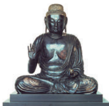
▲宮古の薬師如来坐像