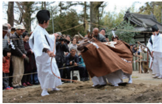
▲鏡作神社の御田植祭

2月18日(日)には、五穀豊穰を祈る祭事、御田植祭が鏡作神社、池神社で行われます。鏡作神社では、戦後復活した御田植祭、