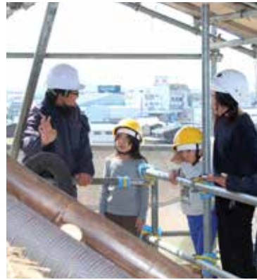
▲職員の説明を聞く