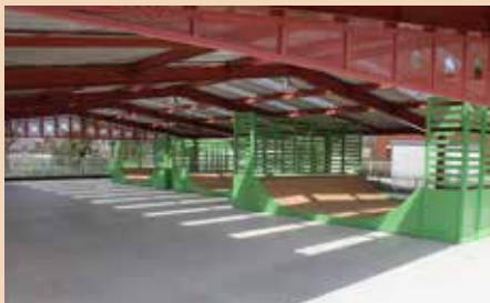
▲スケートボードパーク

昭和 59 年に中央体育館で開催された第 39 回国民体育大会「わかさ国体」フィナーレの写真です。4 月 22 日には中央体育館敷地内にスケートボードパークがオープン。時代とともに活用方法を変え、今も変わらず大切に使い続けられています。