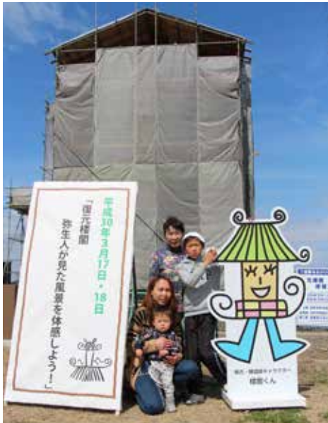
▲修繕工事中の楼閣の前で