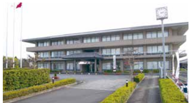
図 人事課 ☎ 34-2056

4月1日から、町役場の組織が一部変更になりました。今回の見直しは、町民の皆さんにより良い行政サービスを効率的に提供できるよう既存の課及び係の再編統廃合を行うもので、変更点は以下のとおりです。