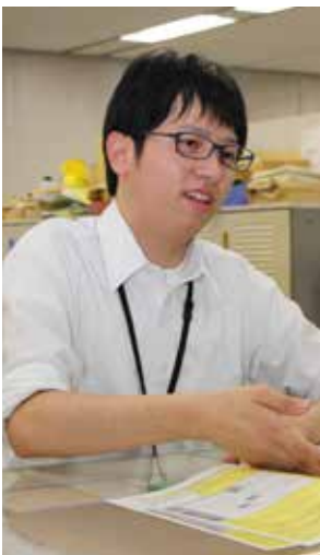
関 人事課人事係 ☎ 34-2056

町では、省エネの一層の推進を通じて、地球温暖化防止を図るため、また、夏季の節電対策の一環として、積極的に町施設における「適正冷房(28℃)」とそれにふさわしい職員の「軽装」(「ノー上着、ノーネクタイ」)を推進しています。 皆様のご理解とご協力をお願いします。