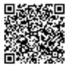
▲唐古・鍵総合サイト

唐古・鍵遺跡史跡公園の開園に合わせて、復元楼閣の修繕が行われました。その工事の足場を利用して、3月17日・18日、楼閣を間近で見ると、イベントが開催されました。町内だけでなく県外からも参加いただき、2日間で467人が参加しました。 参加者たちは、職員の説明を聞きながら、楼閣内部の構造や、楼閣からの眺望を楽しんでいました。 4月17日に唐古・鍵遺跡史跡公園が開園しました。「よみがえる弥生の風景」をぜひ見に来てください。