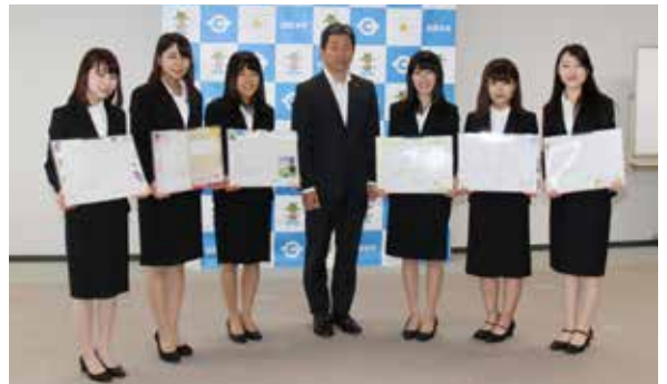
▲オリジナル婚姻届・出生届の受賞者たちと町長