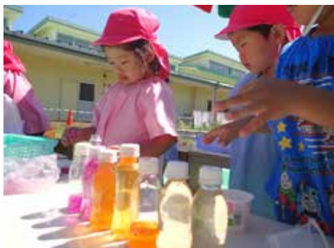
▲花びらをつぶしてギュッとしたら、いろいろな色のジュースができるよ!