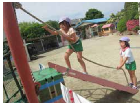
▲にんじゃパワーで、ロープを使って坂登りに挑戦だよ!