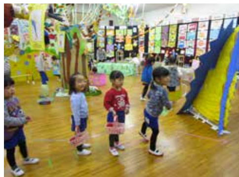
▲いろいろな恐竜がいっぱいいるよ。「恐竜さん、ごはんをどうぞ!!」

作品展「きょうりゅうつうせん」 ～イメージを膨らませて、自分たちで作り上げる満足感～