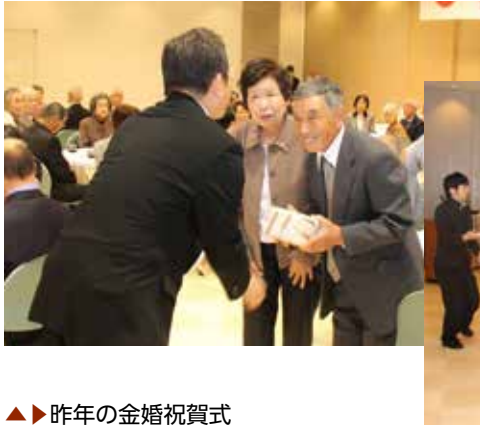
▲▶ 昨年の金婚祝賀式