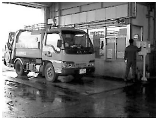
▲ごみが清掃工場に集められる

代表的な方法として、リデュース (Reduce) ・ リユース (Reuse) と呼ばれる、無駄を減らし、同じものを繰り返し使用することでごみを減らす取り組みや、リサイクル (Recycle) と呼ばれる、ごみとして排出された資源を、製品に使用する材料に戻す処理を行うことで再利用する取り組みなどがあります。これらの方法は、頭文字をとり3Rと呼ばれています。リサイクルについての取り組みとして、町では、カン・ビン・ペットボトル・古新聞・ダンボール・古雑