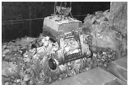
▲集められた多くのごみ。環境への負荷を減らすためにもごみの減量を

また、費用負担の意識を持つていただくことでごみを削減し、環境への負荷を減らす取り組みとして、平成18年の可燃物有料指定袋制を、住民の皆さんのご協力を得て実施しました。