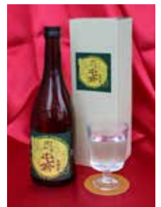
▲さといも焼酎「屯倉」

当日は、三宅町産サトイモと米で作ったサトイモ焼酎「屯倉」のふるまいや記念品の配布も予定していますので、圏域の皆さんの参加もお待ちしております。