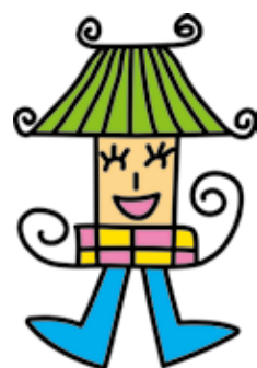
▲唐古・鍵遺跡キャラクター 楼閣くん