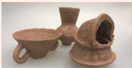
▲弥生土器制作展示・コンテスト (遺構展示情報館)