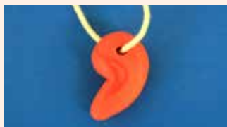
▲粘土の勾玉づくり