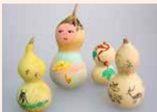
▲ヒョウタンアート