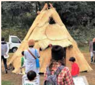
▲竪穴住居をつくろう