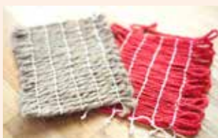
▲アングインコースター