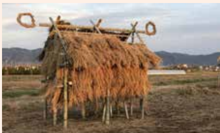
▲わらアート展示・コンテスト (弥生の建物広場ほか)