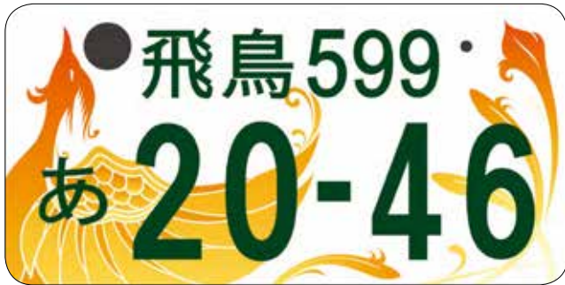
図 総合政策課 ☎ 34-2083

2020年度から交付開始となる「飛鳥ナンバー」。平成30年9月下旬から11月中旬まで図柄案3案についてアンケートを実施したところ、圏域内外から9,089票もの回答をいただきました。ご協力いただきました皆さん、ありがとうございました！