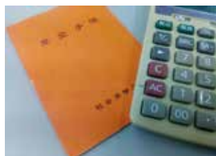
（カッコ内の金額は前納しない場合と比較した割引額）