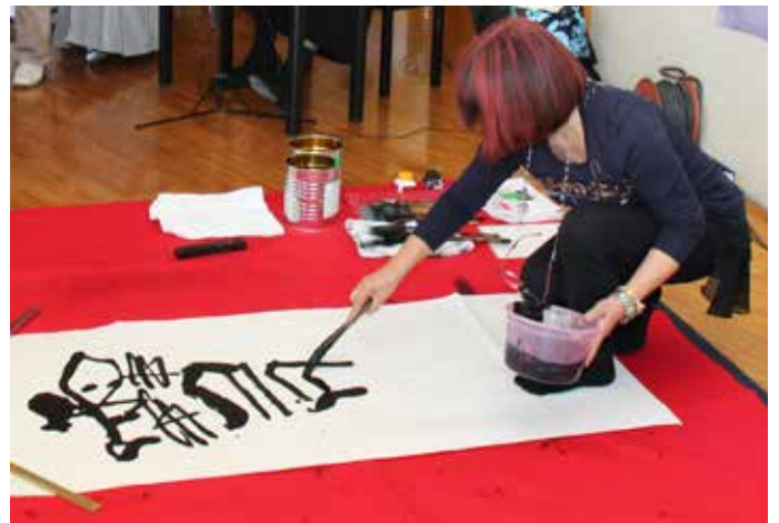
▲ 11月24日に行われたワークショップの様子