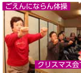
ごえんにならん体操