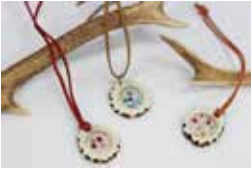
▲シカの角を使ったアクセサリ

協力隊の活動では、観光商品の開発を行うように求められており、捨てるしまうことが多いシカの角を使って商品を開発する「利活用」を積極的に行っています。猟師が狩猟だけでは稼ぐことができなくても、利活用で収入につながるように工夫をしています。その中で今まであまりなかったデザ