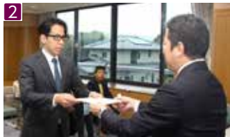
▲集合写真 ▼委嘱状交付