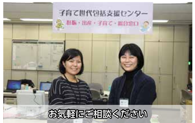
お気軽にご相談ください

妊娠・出産は、女性にとって大きなイベントであり、不安や予測しない出来事、体調の変化やトラブルなどもおきてくる時期でもあります。子育て世代包括支援センターには女性の一生を支える助産師などの専門家を配置し、妊娠・出産・産褥 さんじょく 、さらに赤ちゃんのケア、子育て支援など、女性とパートナーシップをもって、ケアや相談を行っています。