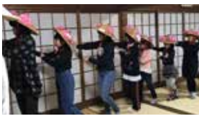
▲御田植舞の練習風景

ます。高齢者には、カフェのような気軽に話せる場所にしてもらえたらと思っています。活動をする中で参加者からの声を実現し、生け花をしたり、いろんな企画をしたりすることがあり、こちらが元気をもらっています。