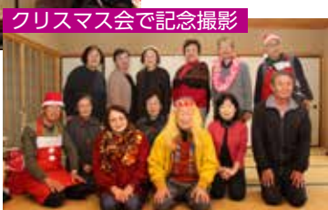
クリスマス会で記念撮影