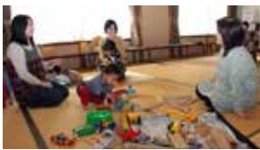
▲子育てクラブぬくぬく

活動を続けられているのは、準備を手伝ってくれる人の支えや、こちらが提案した結果、ありがたい場所を提供していただくこととなった宮司さんの温かさがあってのことです。子育ての悩みはなかなか相談しにくいものです。役場に相談するまでもないこともあると思います。子育てのささいな悩みなどを聞いたり、親同士で話したりすることで少しでも気持ちがいやわらぐ時間になればと思っています。