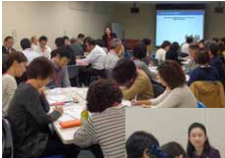
◀経営者・管理職 向けセミナー