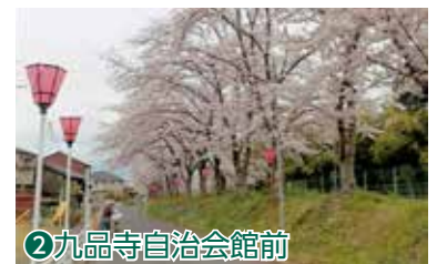
②九品寺自治会館前