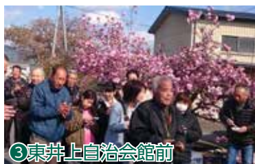
③東井上自治会館前