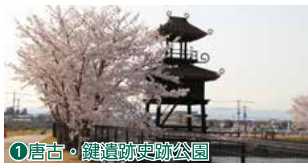
①唐古・鍵遺跡史跡公園