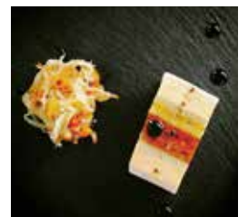
味間いも 穴子 フォアグラのテリーヌ

この料理は東京でしか食べることができませんが、自宅でも味間いもを和食だけでなく、さまざまな料理に使ってみてはいかがでしょうか。