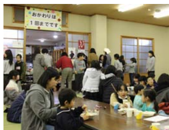
▲大勢の人でにぎわう

温かい雰囲気や皆で味わえる居場所として、天理教田原本分教会が、3月8日に第2回目の「田原本にここ食堂」を開催しました。献立はカレーライス、サラダにデザート。150人を超える人が訪れ、話を弾ませながら楽しいひと時を過ごしていました。