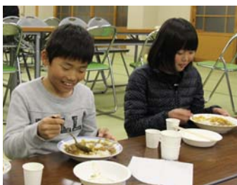
▲カレーライスを前に笑顔