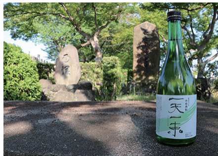
◀ 結崎ネブカを使用した本格焼酎「一天一束」

東のねぎが降ってきた」という地元の伝説にちなみ、「一天一束」と名づけられました。川西町は観世流能の発祥の地であり、古くからねぎの生産地であることを物語る伝説です。