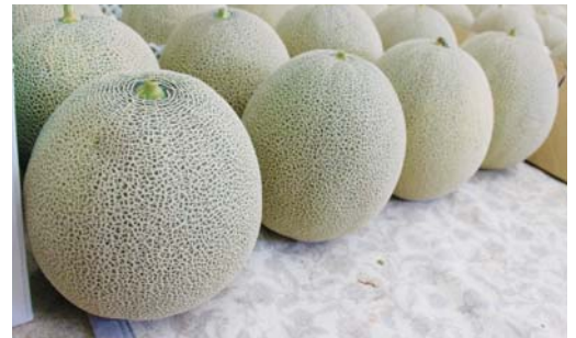
▲農園のオリジナルブランド「感動メロン」全国に栽培指導を行い、農業の発展に寄与。