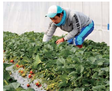
▲栽培に高い技術を要する古都華の土耕栽培。でもそれが「楽しい」

そして、次代を担う子どもたちへの食育もやりたいです。このまちで作られているものを知って、少しでも農業に興味を持ってもらいたいです。 いいものを作る農業者とは