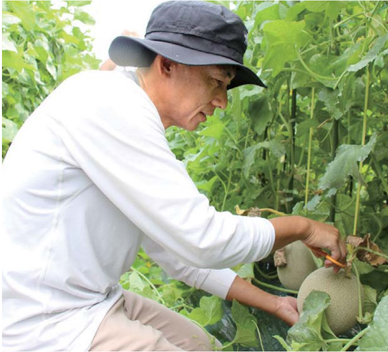
▲実ったメロンの収穫。傷つけないように、慎重にはさみを入れる。