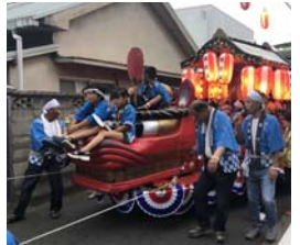
▲だんじりが練り歩く