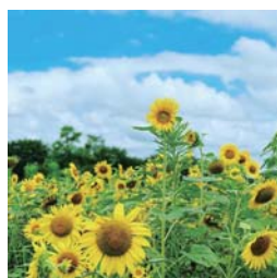
▲唐古の花畑に咲くひまわり