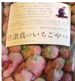
▲冷凍された古都華。ふるさと納税の返礼品として、町の発展にも寄与しています。

今後は販路を拡大するべく、戦略を持って人を雇い利益を出す、経営者になっていこうと考えています。わからないこともありますが、やりたいことはとにかく「やる」のが私のスタンスです。