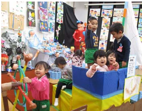
▲海賊船に乗ってネバーランドに出発だ！

詳しい内容や入園についての相談があれば、入園を希望される幼稚園または子ども未来課子ども支援係へご連絡ください。