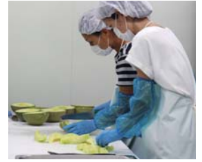
▲果肉はジェラートに利用。無駄なく活用して、廃棄ロスを防いでいます。