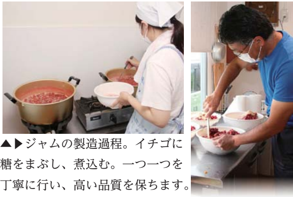
▲▶ジャムの製造過程。イチゴに糖をまぶし、煮込む。一つ一つを丁寧に行い、高い品質を保ちます。