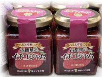
◀古都華を惜しみなく使用したジャム。イチゴ農家の利点を活かし、思い切った商品開発を続けています。