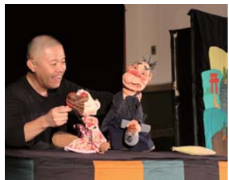
▲人形劇「きつねとためきのばけくらべ」