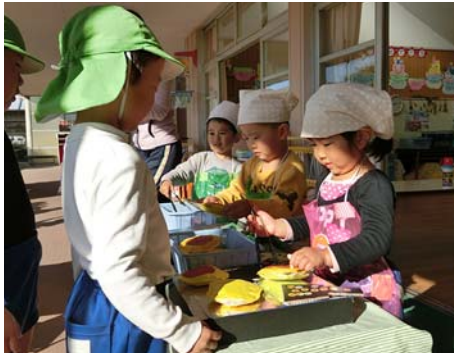
▲「いらっしゃいませ！」おいしいホットケーキが焼きましたよ。

お店屋さんごっこ「ホットケーキ屋さん」 ～友達と言葉やもののやりとりを 楽しむ経験～