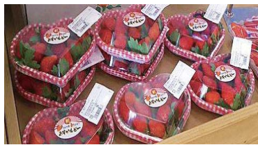
▲パッケージデザインの一つとして、

イチゴやメロンは、生活において必須の食料ではない嗜好品なので、味はもちろん、他にはない、他には負けない特徴を持つことを意識して取り組んでいます。