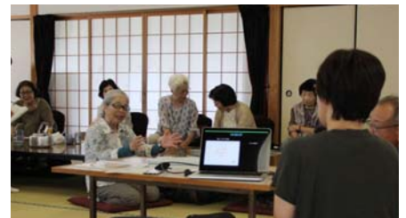
▲参加した人から、防災士の2人に質問