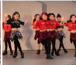
▲ダンスで祭りを盛り上げる