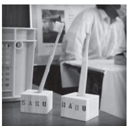
▲自分だけの手作り歯ブラシスタンド

田原本町公式Instagramの6・7月の投稿から、広報担当者イチ押しの写真を紹介します。