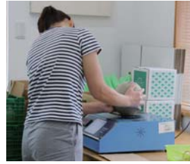
▲計量器で糖度、重量を調べ、糖度が高く、重いものを判別しています。