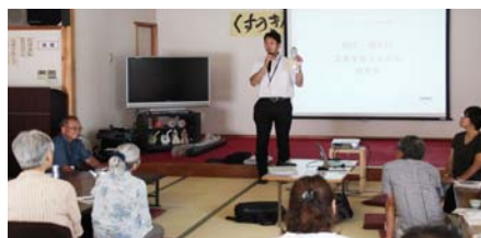
▲町職員から、避難情報や災害電話サービス、保存食などについて説明