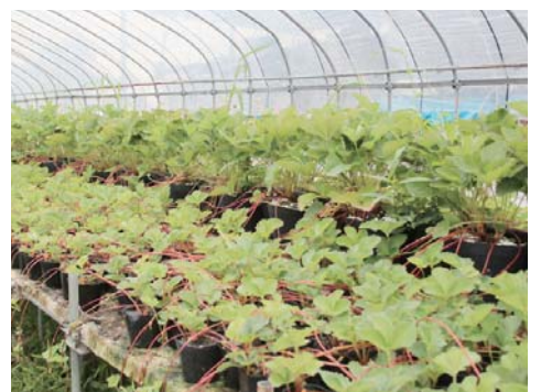
▲古都華、かおり野、あすかるビー、天使のいちご（白イチゴ）の4品種の苗を栽培。

そして、その先にある目標として「イチゴのテーマパーク」があります。価格競争と戦いながら、ひたすら売っていくのも一つの道ですが、スイーツとしてのイチゴの魅力を堪能し、体験できる空間をつくって、一人でも多くの人に幸せになれる時間を提供したい、これが私の進むべき道だと考えています。