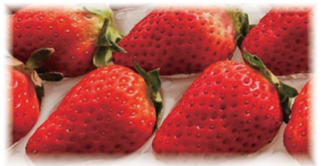
▲奈良県ブランドイチゴ「古都華」。栽培管理が難しいですが、糖度が高く、濃厚な味わいです。