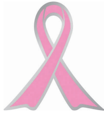
オレンジリボンには 子ども虐待を防止するという メッセージが込められています。

言葉による脅し、無視、きょうだい間での差別的扱い、子どもの前で家族に対して暴力をふるう（ドメスティック・バイオレンス：DV）など