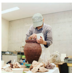
▲ かめ 甕の土器を作成中。これ で炊いたご飯は格別です