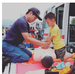
▲田原本町防災フェスタ。 心臓マッサージを体験

田原本町公式Instagramの8・9月の投稿から、広報担当者イチ押しの写真を紹介します。