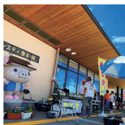
▲道の駅レスティ唐古・鍵 大感謝祭。熱い一日でした