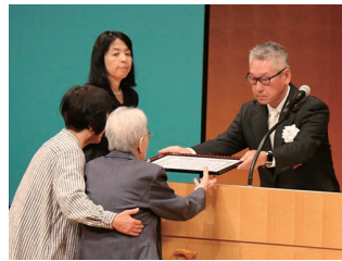
▲文化団体40周年記念式典で永年表彰を受ける