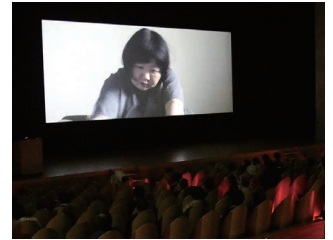
▲地域発信型映画「I~アイ~」の上映会