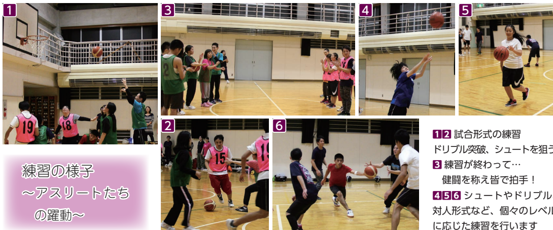
練習の様子 ～アスリートたち の躍動～