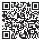
折込チラシデータ