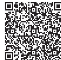
川西町ホームページ

もっと何かに関わりたい」。そんな人、ぜひ仲間になってくれませんか?あなたの得意がきっと、まちの魅力になります。