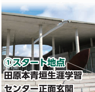
①スタート地点 田原本青垣生涯学習 センター正面玄関

田原本青垣生涯学習セン ターから唐古・鍵遺跡史跡公 園までのコースで、約 2km の行程を 9 区画に分けて走行 します。