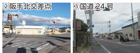
②阪手北交差点から、③国道 24 号を北へ