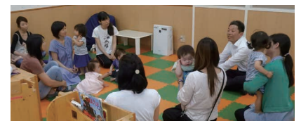
▲町民の皆さまの声、田原本町のより良い未来をつくる原動力になります

まちづくりの主役は皆さまです。多くの声をお聞きし、積極的にまちづくりに参画していただけるシステムづくりやコミュニティ活動の促進とともに、計