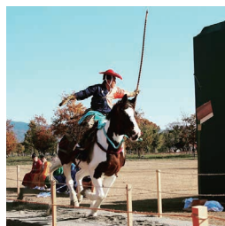
▲奈良田原本流騎馬まつり。大迫力でしたね!