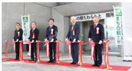
▲開所式・テープカットの様子