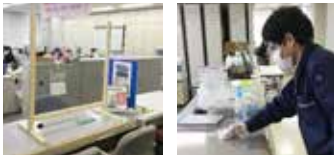
▲飛沫感染などの防止に、窓口へのアクリル板設置、町職員による机などの消毒など、庁舎内の安全性を確保するため努力しています

新型コロナウイルス感染症は、世界中で猛威を振るっています。アメリカ、ヨーロッパ、中国などで感染が広がっており「医療崩壊」の危機に直面しています。そして日本でも、4月7日に発令された緊急事態宣言、予想以上の感染拡大、外出自粛による閑散とした各地の様子、著名な芸能人の逝去など、短期間の事態収束は考えられない状態となっています。