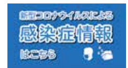
▲町ホームページなどで情報を更新しています

※「医療崩壊」…ここでは、患者数の急増などによる医療従事者や医療器具の不足で、治療に手が回らない状態を指す