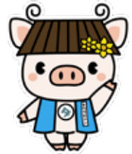
田原本町公式キャラクター 「タワラモトン」

本紙7月号でお知らせしたように、活動量計などの ICT 機器を使った「ヘルスケアプロジェクト-健幸ポイント事業-」が10月から始まります。生涯にわたって健康で幸せに暮らせるよう、事業に参加して健康づくりを始めてみませんか。