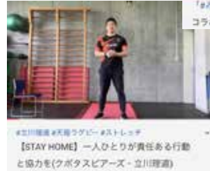
「#みんなの特別授業」～ツアーと一緒に コラボしてみよう！～