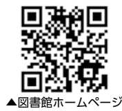
▲図書館ホームページ