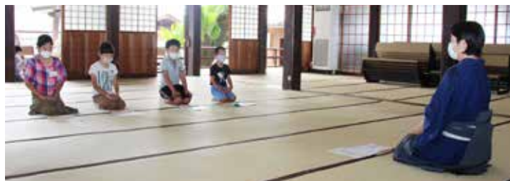
◀▲舞、謡をそれぞれグループごとに練習しています