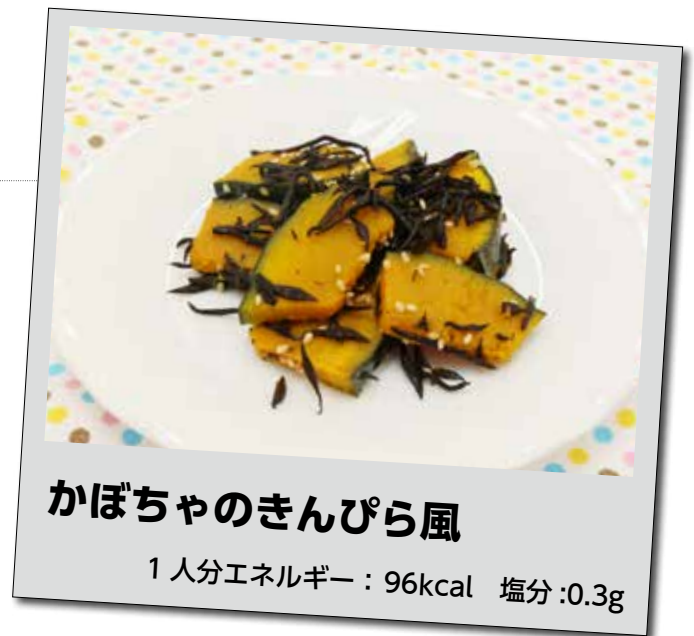
かぼちゃのきんぴら風

食塩の摂りすぎが高血圧の要因になるのは、食塩に含まれる「ナトリウム」が原因です。減塩することはナトリウムを減らすことになり高血圧予防になります。栄養成分表示からナトリウムの量を食塩に換算できます（下記参照）。食品の購入時は、食塩がどれくらい入っているか確認して購入するとよいでしょう。 「ナトリウム」を食塩に換算する方法 食塩相当量 (g) = ナトリウム量 (mg) × 2.54 ÷ 1,000