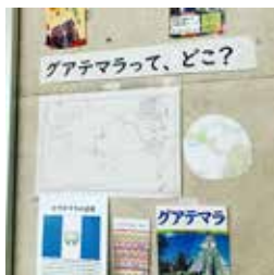
▲事態が終息したら、また来てくださいね