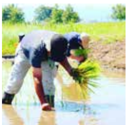
▲史跡公園で苗を育てる！新しい試みが始まっています

田原本町公式Instagramの6・7月の投稿から、広報担当者イチ押しの写真を紹介します。