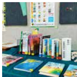
▲夏休みの読書感想文、うまく書けたかな？