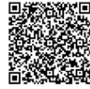
▲定期予防接種 について

※各種予防接種の内容に関する相談や転入などで予診票を持っていない人は、保健センターへお問い合わせください。