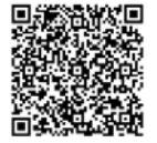
▲町内委託医療 機関について