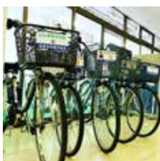
▲観光ステーション「磯城の里」のレンタサイクルでまちを巡ろう

田原本町公式Instagramの8・9月の投稿から、広報担当者イチ押しの写真を紹介します。