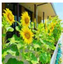
▲史跡公園の大きなひまわり。夏が来たなって感じですよ