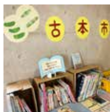
▲図書館でミニ古本市開催中！ 欲しかった本が見つかるかも…