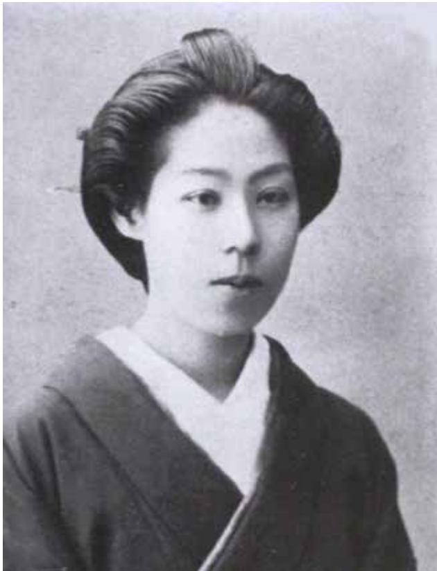
五代豊子の写真