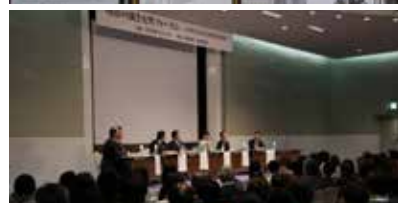
◀▲五代友厚の生きざまを学び、伝える団体・五代友厚プロジェクトの協力による特別展示(昨年度町役場で実施)や「五代豊子フォーラム」などにより、五代友厚、豊子についての掘り下げが行われました