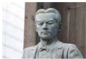
▲五代友厚像

所)、大阪商業講習所(後の大阪市立大学)などの開設に携わり、維新後に傷ついた大阪経済の立て直しに尽力しました。