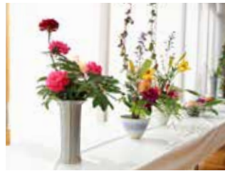
▲美しく生けられた花