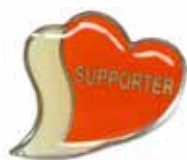
あいサポートバッジ

り組まれており、田原本町でも平成30年度から運動を実施する市町村として参加しています。