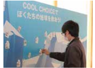
▲地球温暖化に対するメッセージ