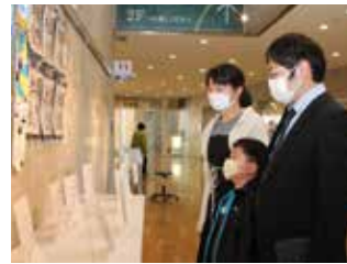
▲小学生が作成した作品を鑑賞