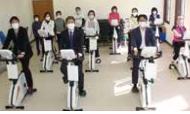
▲エアロバイクなどを活用し、効果的な運動を支援していきます