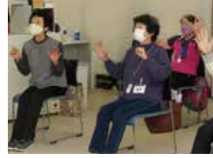
▲両手で違う動作を行い、緊張をほぐしました

町では、ICT を活用して健康増進に取り組む「たわらもとヘルスケアプロジェクト」を10月から開始しています。10月27日に、当プロジェクトの重要な柱の一つである「健幸運動教室」の開講式を行いました。ICT を用いて参加者の努力と成果を「見える化」することで、継続を促進していきます。