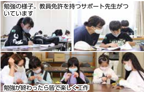
勉強の様子。教員免許を持つサポート先生がっています