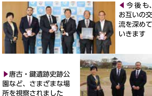
◀ 今後も、お互いの交流を深めていきます

天理教田原本分教会では、学校の宿題をサポート先生と一緒に勉強する「にこにこクラブ」を9月より行っています。「にこにこクラブ」は、学習塾のようなサポートではなく、お子さん一人一人の学力に合わせて、サポート先生と一緒に理解しながら宿題を解いていきます。