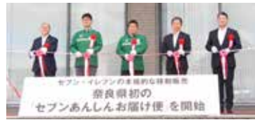
◀ 出走式・テープカットの様子