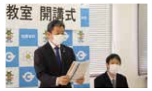
▲森町長による、いきいき健幸のまちたわらもと宣言

町では、ICT を活用して健康増進に取り組む「たわらもとヘルスケアプロジェクト」を10月から開始しています。10月27日に、当プロジェクトの重要な柱の一つである「健幸運動教室」の開講式を行いました。ICT を用いて参加者の努力と成果を「見える化」することで、継続を促進していきます。